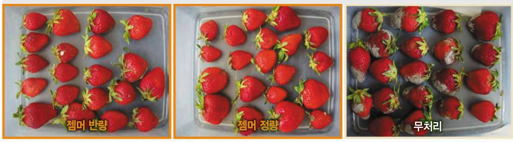
국내 시험 사진(딸기 잿빛곰팡이병) 동방아그로 기술연구소