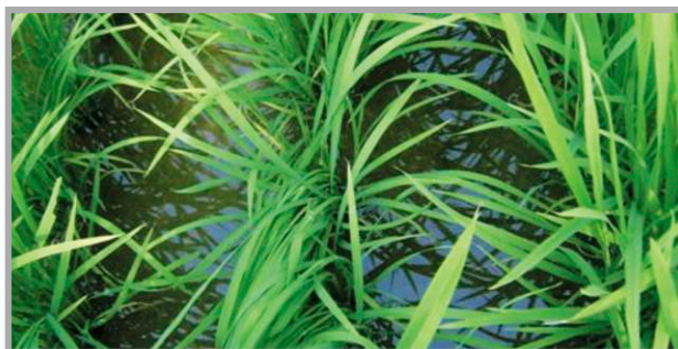
▲ 5월 18일 : 이앙 11일 후 처리 22일차 (충남 서천)