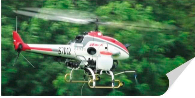
▲ 실제 무인항공 살포 장면