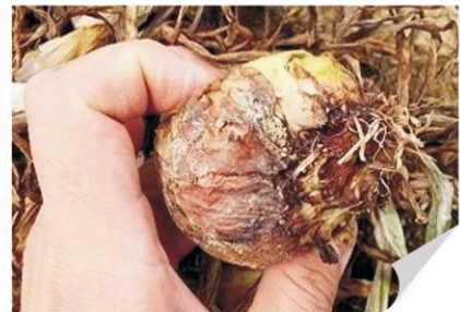
▲ 마늘 고자리파리