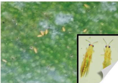
▲ 감귤 볼록총채벌레