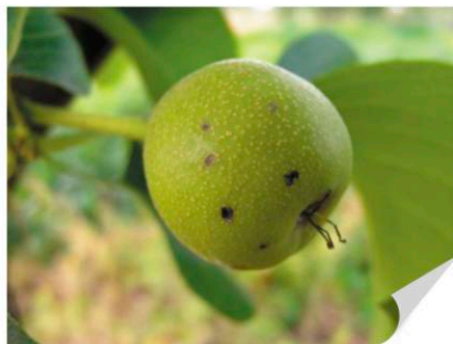
▶ 배 검은별무늬병