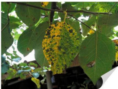
▶ 사과 갈색무늬병