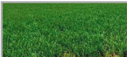
▲ 강원 고성군 (처리 후 45일)