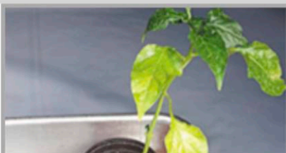
진딧물 떨어진 흔적