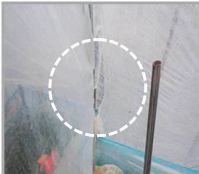
하우스 측면 비닐 찢김