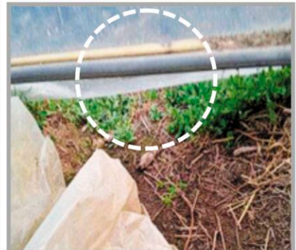
철제 밭 비닐이 지면과 닿지 않음