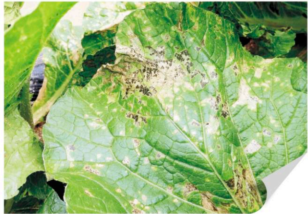
▲ 배추 노균병