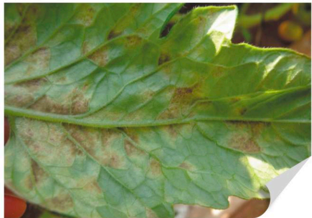
▲ 토마토 잎곰팡이병