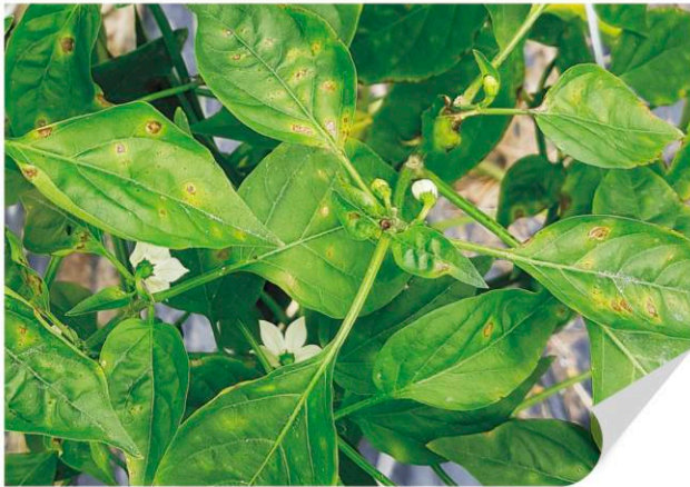
▲ 고추 세균점무늬병