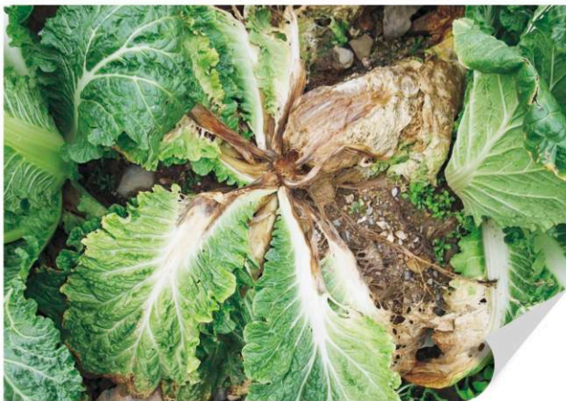
▲ 배추 무름병