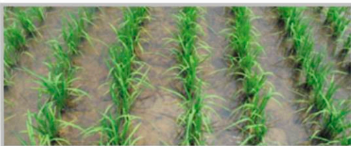
▲ 이앙 후 10일 처리(6월4일)후 17일 경과(2010, 황성)