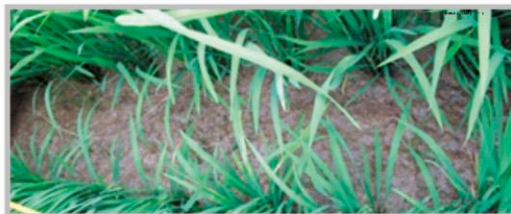
▲ 이앙 후 10일(5.24)처리 후 37일 경과