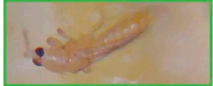
▲ 처리 후 6시간