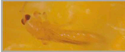
▲ 처리 후 3시간