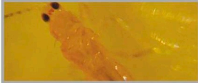
▲ 처리 후 1시간