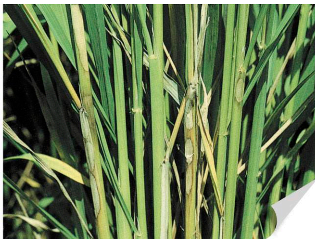
▲ 벼 잎집무늬마름병